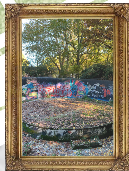
FOSSA delle SCIMMIE

La fossa delle scimmie era una volta collegata attraverso tunnel sotterranei alla loro gabbia, di modo che potessero circolare all'interno dei due spazi. Oggi è al suo interno interamente decorata da opere di street artists non autorizzati.