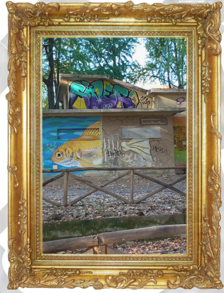
CASA della TIGRE

La Casa della Tigre è il primo edificio che si incontra passeggiando all'interno del parco. È stato uno dei protagonisti dell'intervento dello Street Art Museum promosso dall'associazione BorderGate. I suoi ingressi sono oggi murati per impedire l'ingresso ai non autorizzati.