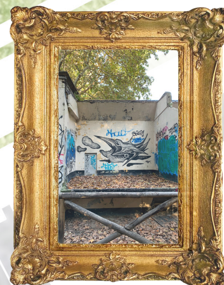
GABBIE delle SCIMMIE

Le gabbie delle scimmie, un tempo collegate alla fossa tramite tunnel sotterranei, sono oggi abbandonate e presentano murales di duplice tipo: alcuni sono di matrice autonoma, altri fanno riferimento all'intervento dello Street Art Museum promosso dall'associazione BorderGate.