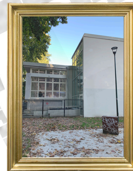
BIBLIOTECA A. GEISSER

La biblioteca Alberto Geisser è un'istituzione per il quartiere di Borgo Po. Dopo anni di chiusura, a Novembre 2023 ha riaperto e al suo interno è stata organizzata una mostra in occasione di Artissima.