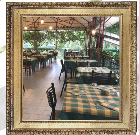
S.I.S BOCCIOFILA La locanda sul Po

Bocciofila del quartiere. All'interno vi è anche una trattoria dove poter mangiare.