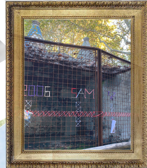
GABBIE dei FELINI

Le gabbie dei felini presentano oggi un'opera di matrice autonoma ricamata sulla rete metallica che le delimita. L'opera mira a ricreare una linea del tempo, che arriva fino ai giorni nostri denunciando l'abbandono del parco.