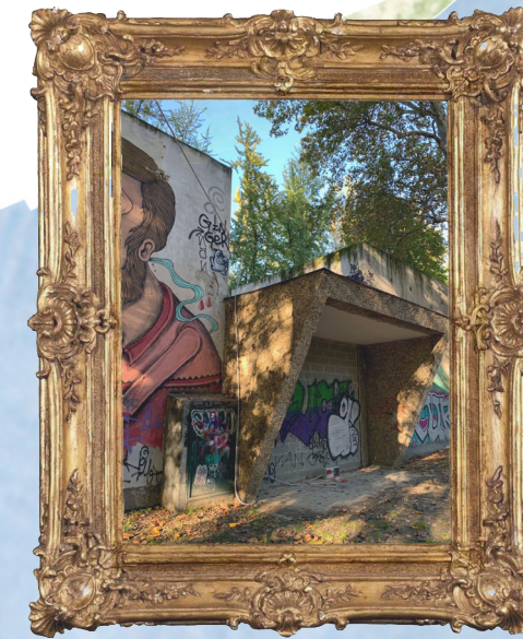
CASA della GIRAFFA

La Casa della Giraffa è oggi murata per impedire l'ingresso ai non autorizzati. All'interno del suo portale di ingresso in occasione di Artissima 2023 è stato collocato uno schermo al fine di proiettare l'opera dell'artista brasiliano Jonathan de Andrade, intitolata "Nó na garganta".