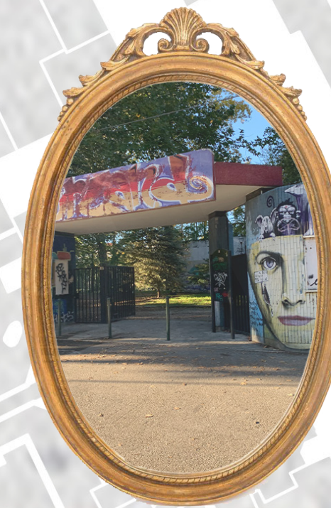
INGRESSO al PARCO

Qui vi era la biglietteria del giardino zoologico, oggi è uno degli ingressi al Parco Michelotti. La sua parete è ricoperta da murales e opere.